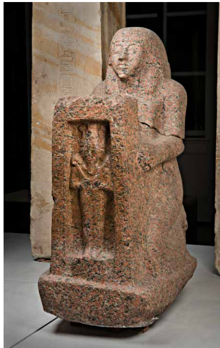
Fig. 21. Naofoor van Neferrenpet, RMO, inv. no. AST 16 (D 44).