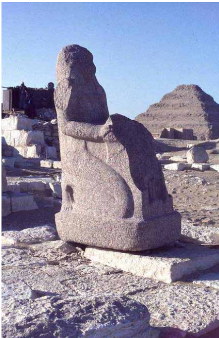
Fig. 20. De naofoor in het graf van Neferrenpet in Sakkara (1981).

De vizier Neferrenpet was zoals gezegd in functie tijdens de lange regering van Ramses II en wel aan het eind daarvan. Hij kreeg bijvoorbeeld de taak diens 10e en 11e Sedfeest aan te kondigen, rituele jubilea die in het 57e en 60e regeringsjaar van Ramses II werden gevierd. Neferrenpets werkterrein was voornamelijk Opper-Egypte, maar zoals we weten van verscheidene andere hoge ambtenaren uit die tijd liet ook hij zijn grafcomplex aanleggen in de dodenstad van de aloude hoofdstad Memphis. Hij liet behalve dit imposante gebouw heel wat monumenten na; een recente studie somt er een dertigtal op. Een probleem hierbij is dat er nog een vizier was met de naam Neferrenpet, die zijn ambt vervulde tijdens de regeringen van Ramses IV, V en VI, zo'n